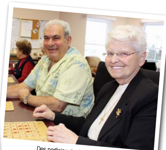
Des participants du centre de jour

journée! » Pour une personne qui souffre de la maladie d'Alzheimer, chaque journée représente un combat... contre le désespoir.